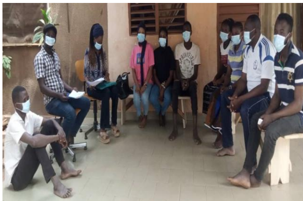
Photo 2 : Entretien avec la coordination des jeunes